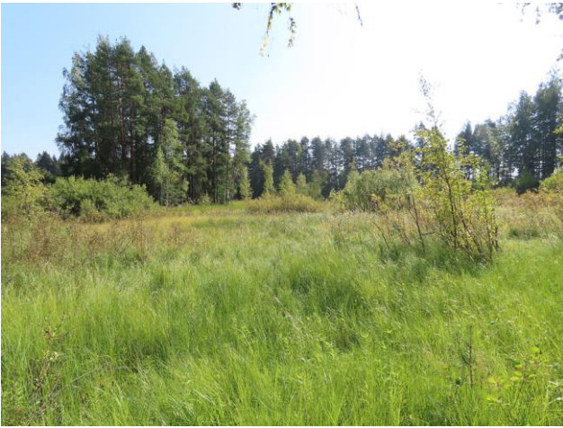
Kuva 1. Suunnittelualueen eteläosan luhtaa. Kuva etelään, Pappilanlahden suuntaan.

Koskenselän suunnittelualue rajautuu etelässä Pappilanlahteen ja sitä ympäröivään luhtaan (Kuva 1.) ja lännessä Koskenselkään (Kuva 2.). Idässä suunnittelualue ulottuu Koskenseläntien itäpuolen loivasti kumpuilevalle, kiviselle mäki-alueelle (Kuva 3.) ja pohjoisessa suunnittelualue rajautuu korkeaan kallioiseen mäkeen. Leirintäalue rakennuksineen sijoittuu Koskenseläntien ja Koskenselän rannan väliselle alueelle. Koskenseläntien länsipuoli on aivan eteläisintä osaa (Pappilanlahden aluetta) lukuun ottamatta kokonaan leirintäalueena (Kuva 4.). Koskenseläntien itäpuolen mäntykankaalle on rakennettu frisbeerata ja luontopolku (Kuva 3.). Leirintäalueen pohjoisosan rakennetulla alueella on muinaismuistokohde (Kartta 1., SM/4). Alueet, joilla ei ole rakennuksia, sijoittuvat suunnittelualueen eteläosaan Pappilanlahden ympäristöön (Kuvat 1., 5. ja 6.) sekä Koskenseläntien itäpuolelle (Kuva 3.).