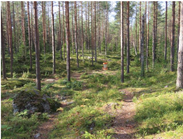
Kuva 3. Koskenseläntien itäpuolen kalliomäet ovat harvennettua nuorehkoa mäntykangasta (MT)