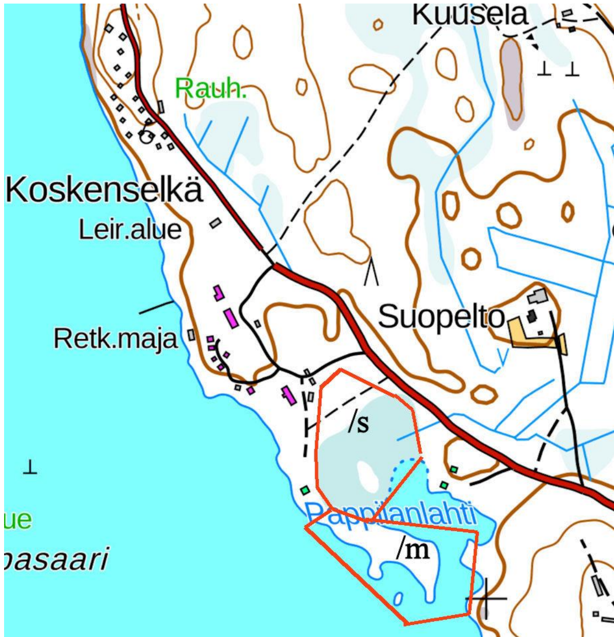
Kartta 2. Luonnon monimuotoisuusalue (/s) ja maisemallisesti merkittävä alue (/m) suunnittelualueella.