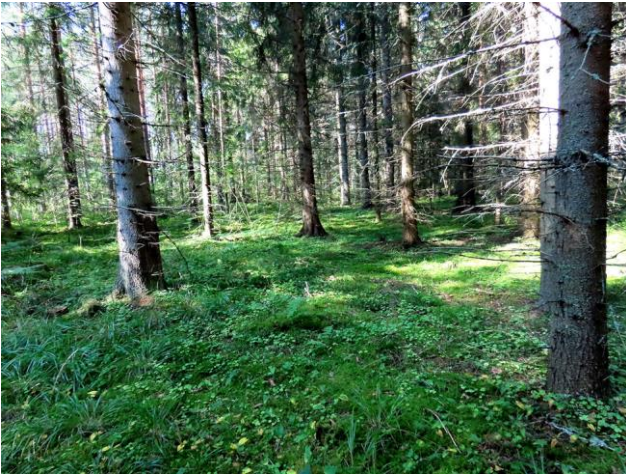
Kuva 5. Pappilanlahden luhdan rantoja rajaa harvennettu kuusivaltainen lehto (OMaT)/korpi.