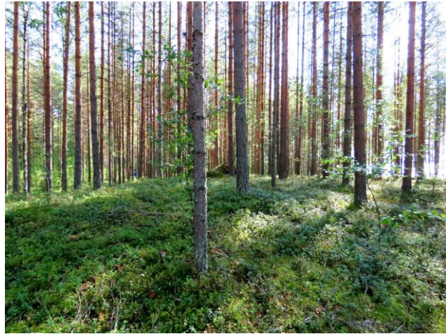
Kuva 6. Leirintäalueen eteläosan pienehköt rakentamattomat alueet ovat mäntykangasta (MT).