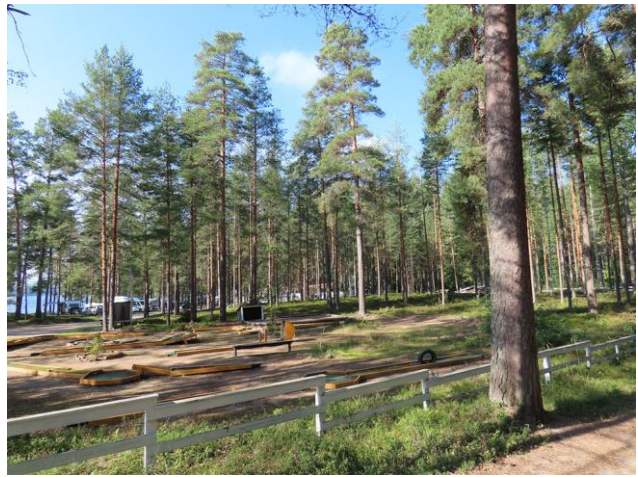
Kuva 4. Leirintäaluetta luoteeseen kuvattuna. Taustalla karavaanarialue.