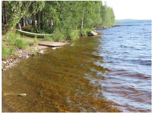
Kuva 2. Suunnittelualueen länsirantaa etelään kuvattuna. Sorarannat ovat lähes kasvittomia.